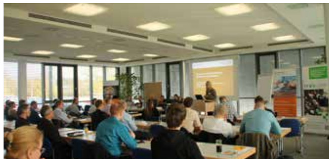
Veranstaltung zum Thema IT-Sicherheit

Im Rahmen der Förderinitiative „eKompetenz-Netzwerk für Unternehmen“ des Bundesministeriums für Wirtschaft und Technologie, stellt der eBusiness-Lotse Oberfranken den hiesigen Unternehmen anbieterneutrale und praxisnahe Informationen für deren digitale Geschäftswelt zur Verfügung. Die Angebote der Projektpartner, Institut für Informationssysteme der Hochschule Hof und IGZ Bamberg in Kooperation mit dem IT-Cluster Oberfranken, richten sich besonders an KMU und das Handwerk. Der Fokus liegt dabei auf den Themen Online-Marketing, Cloud und Informationssysteme für ressourceneffiziente Prozesse.